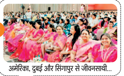
अमेरिका, दुबई और सिंगापुर से जीवनसाथी...